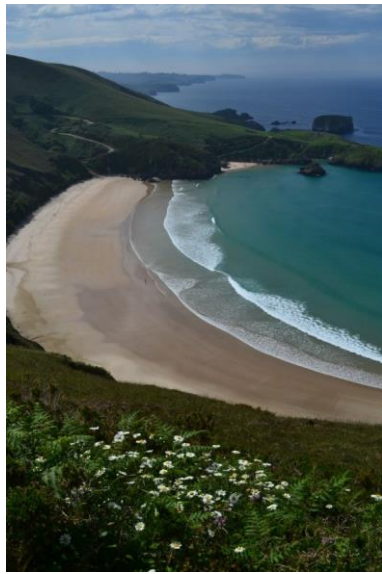
Playa de Torimbia

La iglesia y su campo sagrado situados en la ensenada se construyeron en 1794.