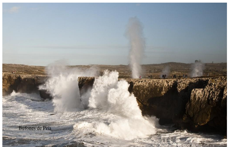
Bufones de Pría

Dejando el pueblo a vuestra izquierda llegaréis a la entrada del pequeño puerto, a una estrecha y tranquila playa fluvial ya uno de los lugares más bonitos de Asturias, su iglesia asomando a la ría. Es un lugar mágico que ofrece muchas perspectivas para observar y fotografiar.