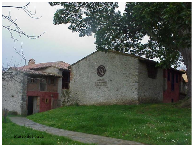
Museo de Porrúa

Rocamar: En la misma playa. Tiene terraza con vistas preciosas a la playa. 985401213