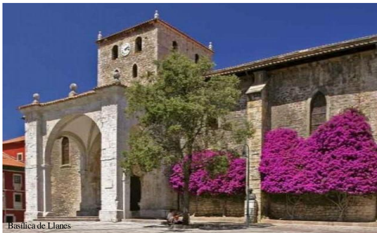
Basilica de Llanes

El bufón de Santiuste , cerca del castro del mismo nombre, se alcanza caminando unos 500 m desde un aparcamiento a 3 km de Buelna.